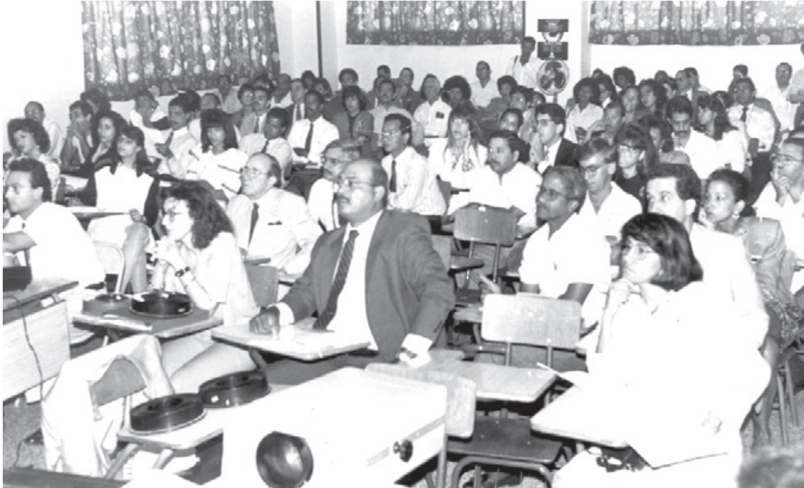
Los asistentes al III Curso Anual de Actualización realizado en el INDEN.