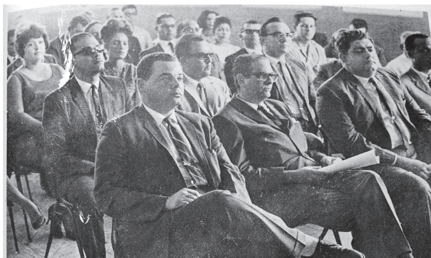
Miembros de la Sociedad Dominicana de Oftalmología.